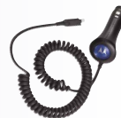
Caricabatterie auto (VC700)