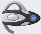
Auricolare Bluetooth™ (HS820)