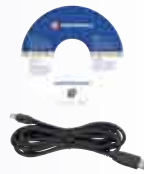
Mobile Phone Tools 3.0 + cavo USB (PC220)