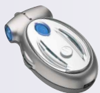
Vivavoce Bluetooth™ (HF800)