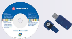
Mobile Phone Tools 3.0 + modulo Bluetooth™ USB (PC820)